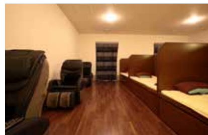
リラクゼーションルーム ●個室の様に独立した空 間を持つベッドスペースでお休みいただけます。 また、マッサージチェアもご用意しています。