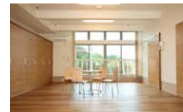
談話室 ●入所者同士のコミュニケーション に、来訪されたご家族との歓談にと多目的 にご利用いただけます。