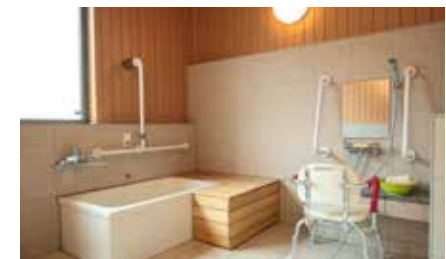
浴室 ●脱衣所、浴室の広々としたバリアフリーな空間 に入浴をサポートする各種設備が配されています。