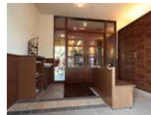
玄関 ●車いすや歩行器などでもご利用しやすいよう十分な開放スペースがある玄関です。

セントラルホール ●受付のあるホールには訪問者ご家族の 歓談等のためのスペースです。ご一緒にいらっしゃったお子 様のための遊び場スペースや入居者のためのミニ図書館 等を併設しています。