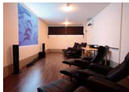
シアタールーム ●大型スクリーンで楽しむ懐かし の名画。リクライニングチェアに体をあずけ、リ ラックスした一時をどうぞ。